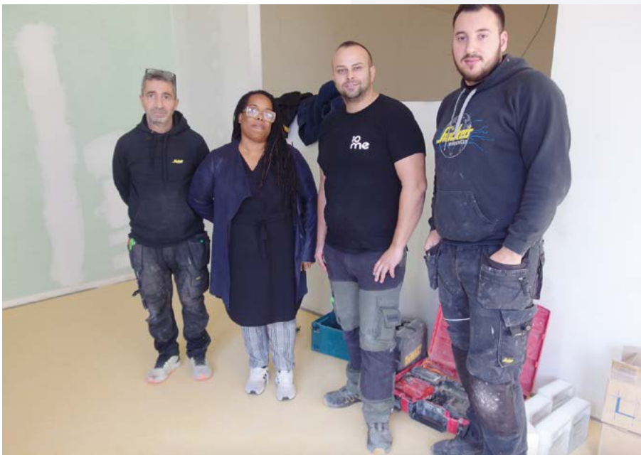
Équipe des ouvriers avec la directrice

Après plusieurs années d'études techniques et de négociation administratives, un projet d'humanisation a été validé par le Conseil d'administration pour un montant minimal de 300 000 €.