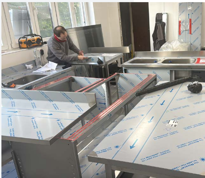
Montage des appareils de la cuisine du home Clair Matin