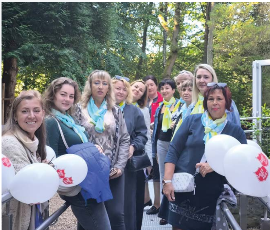
Le centre de réfugiés de l'Armée du Salut à Spa a accueilli des femmes médecins ukrainiennes du 20 au 29 septembre.

Au-delà des visites culturelles, ces médecins ont aussi vécu des moments