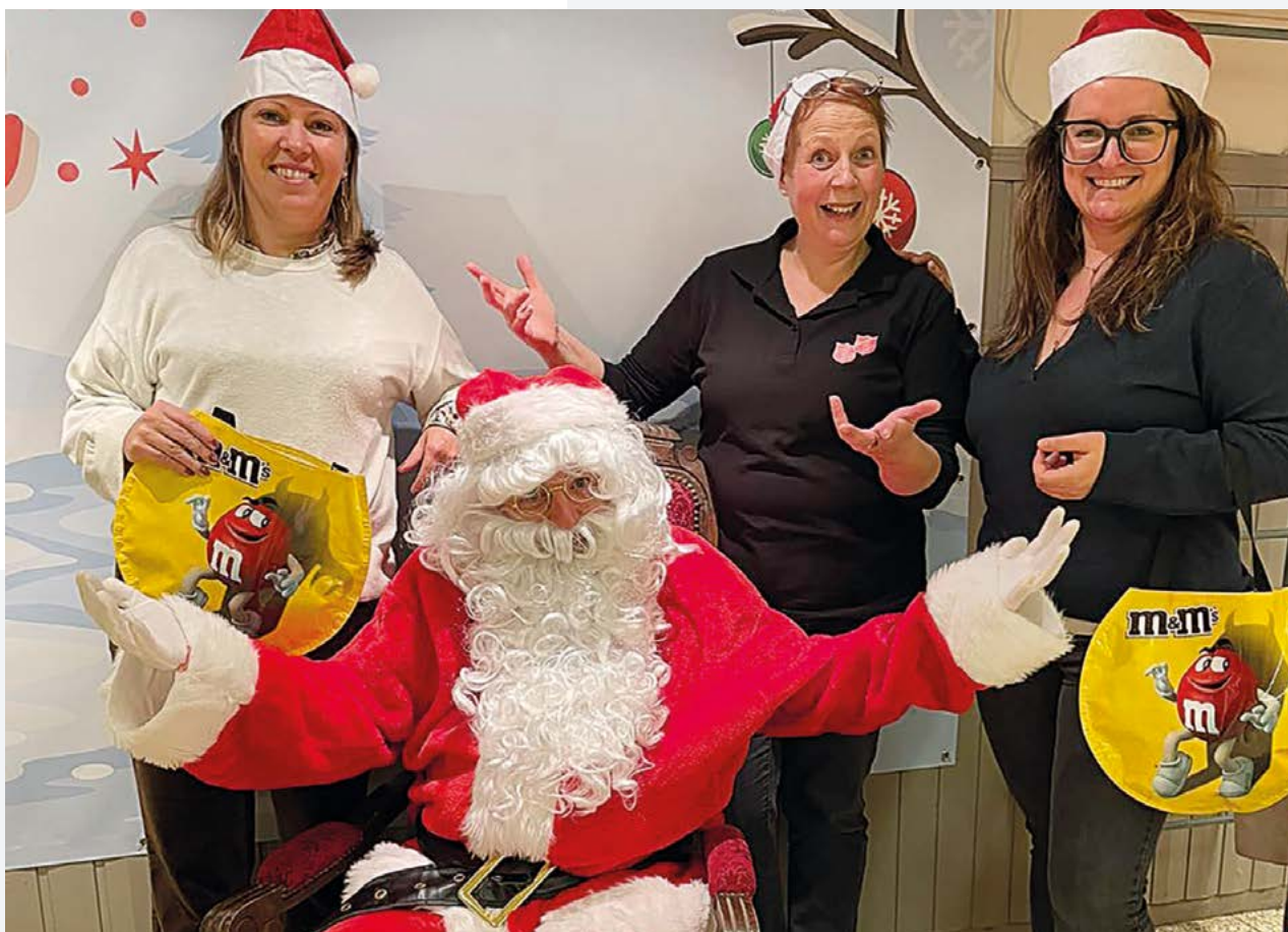
Le projet « Angel Tree » mis en place par l'Armée du Salut permet de créer un lien entre le monde de l'entreprise et le monde associatif.