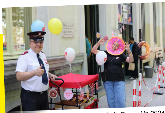
Bedeling van donuts te Brussel in 2024

Ontstaan in 1938 in de Verenigde Staten en later in veel landen geïntroduceerd, is Donut Day een dag van feest en ontmoeting.