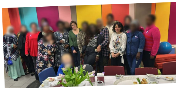
Ontmoeting in Foyer Selah

Na een succesvolle eerste editie in 2024 organiseert Foyer Selah in Brussel ook in 2025 een bijeenkomst om al haar bewoners te verzamelen rond het thema van de vrouw.