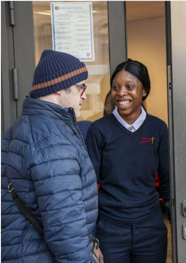
Een onvoorwaardelijk onthaal

De voorbereiding en uitdelen van solidariteitsmaaltijden en voedselpakketten vereist de inzet van een ketting van onmisbare schakels, zonder wie deze acties niet mogelijk zouden zijn. Dat zijn de vrijwilligers en vaste medewerkers van het Leger des Heils, maar ook partnerbedrijven, mecenasen, donateurs en openbare diensten (onder andere de OCMW's en niet te vergeten de Voedselbanken en Europese fondsen). ■