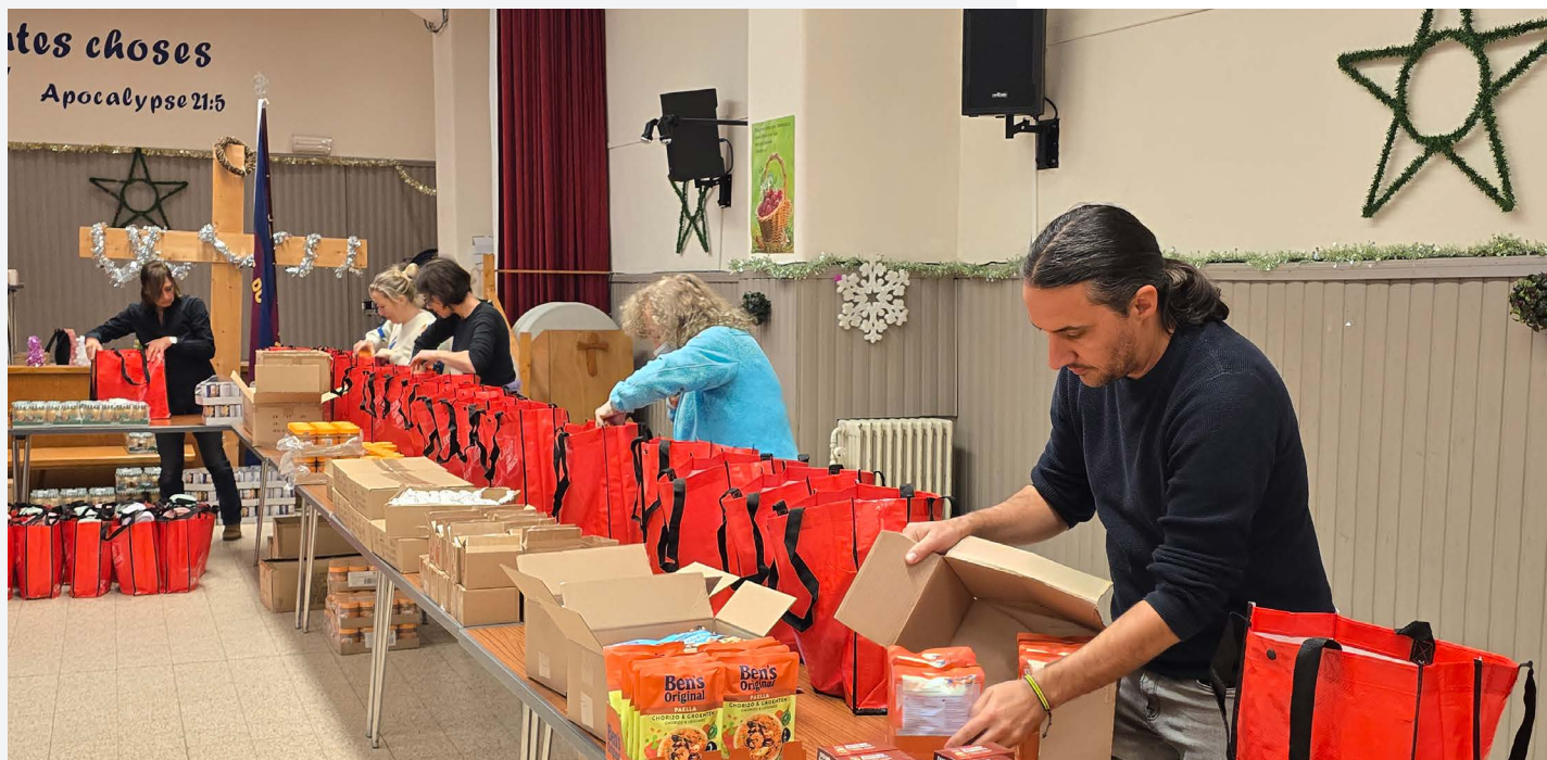
Klaarmaken van de kerstpakketten, december 2024 in Brussel

De kerstperiode, midden in de winter, is één van de grote hoogtepunten van het jaar voor onze voedselhulpactie. In 2024 – zoals al meer dan 50 jaar in Brussel – organiseerde het Leger des Heils een grote kerstpakkettenactie voor daklozen, mensen die in moeilijke of in eenzame omstandigheden leven.