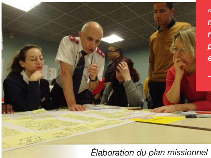
Élaboration du plan missionnel

« Le cœur profond n'est ni l'émotion, ni l'affectivité, ni le sentiment. Il n'est ni la psyché ni l'intellect ou la raison. C'est le centre de notre être, notre noyau le plus intime, le cœur du cœur. Il peut être méconnu, en sommeil, fermé, mais il ne peut mourir ».