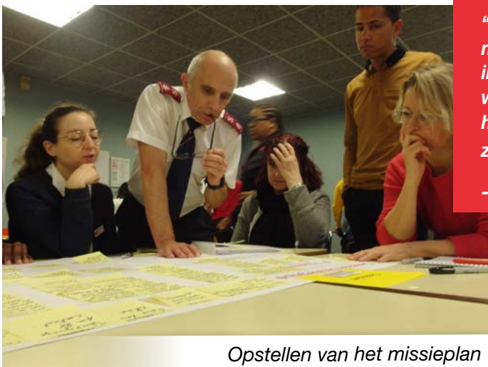
Opstellen van het missieplan

“Het diepe hart is noch emotie, noch affectiviteit, noch gevoel. Het is noch de psyche, noch het intellect of de rede. Het is het centrum van ons wezen, onze meest intieme kern, het hart van het hart. Het kan onbekend zijn, in slaap zijn, gesloten zijn, maar het kan niet sterven.”